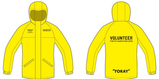
コース整理などのボランティア