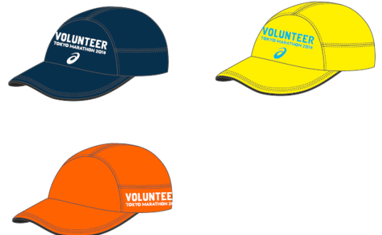
ボランティアキャップ