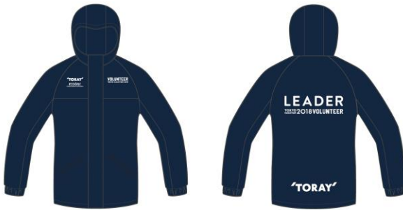
ボランティアリーダー